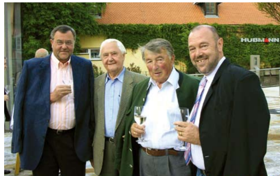
So sehen Bürgermeister aus, die unser Kaiser angeblich verbraucht hat...