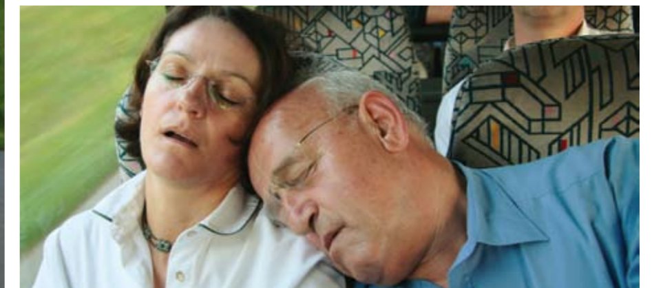
Die ständige Blinkerei macht müde