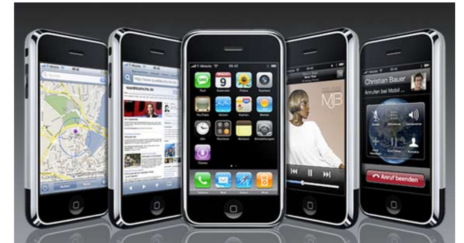
So sah Gernots Handy nach seiner wundersamen Reise aus...